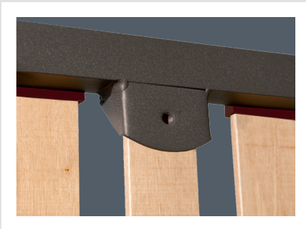
PLATINE POUR PIEDS

Nous nous réservons le droit de modifier les caractéristiques de nos produits à tout moment et sans préavis. La photo de l'article n'a pas de valeur contractuelle.